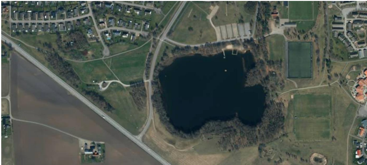
Glänninge sjö samt idrottsplats.

Som synes på bilden nedan är planen belägen inom ett kort avstånd, strax till höger om Glänninge sjö.